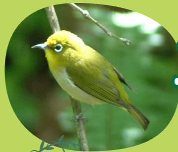
1 Birds メジロ