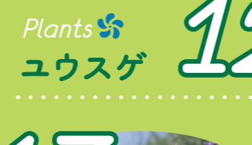
12 Plants ユウスゲ