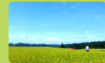
B 三瓶山神社周辺 その1