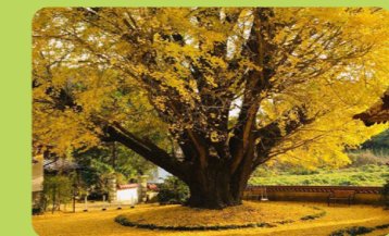
C 浄善寺大イチョウ