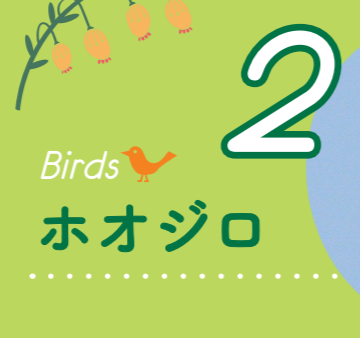
2 Birds ホオジロ