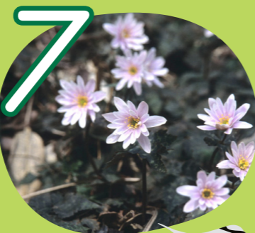
7 Plants ユキワリイチゲ