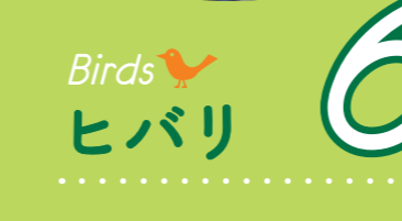
6 Birds ヒバリ