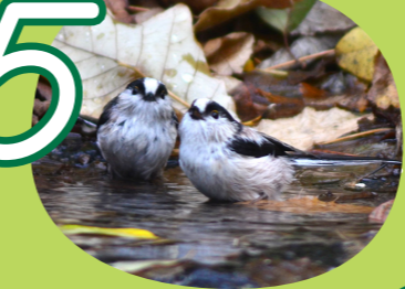
5 Birds エナガ