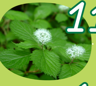
11 Plants コアジサイ