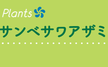
14 Plants サンベサワアザミ