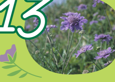
13 Plants マツムシソウ