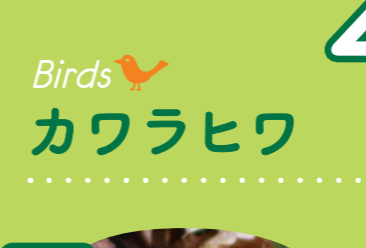
4 Birds カワラヒワ