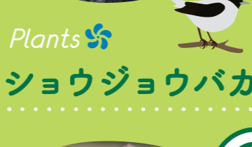
8 Plants ショウジョウバカマ