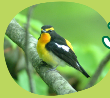
3 Birds キビタキ