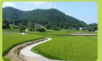
B 三瓶山神社周辺 その2