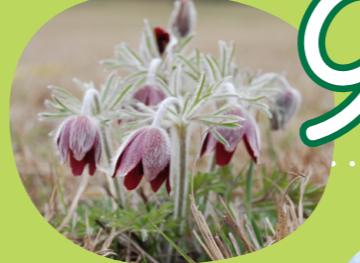
9 Plants オキナグサ