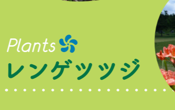
10 Plants レンゲツツジ