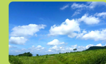
西の原 クロスカントリーコース